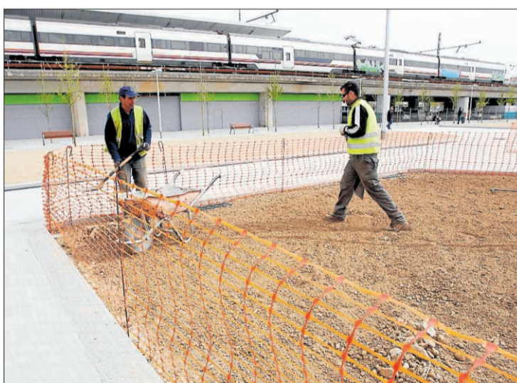
Operaris treballant a la zona per enjardinar.